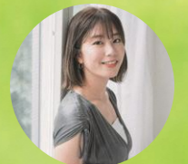
[ゲストランナー] 稲村 亜美